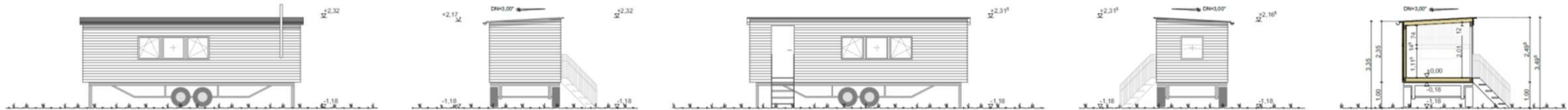
SCHNITT A-A M1:100